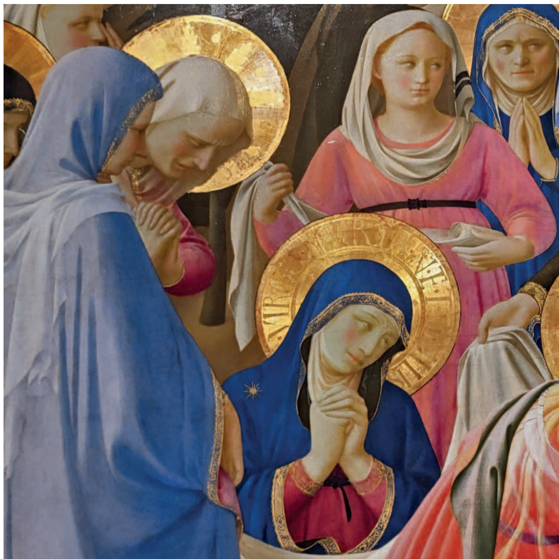
Beato Angelico, Pala di Santa Trinità (Deposizione dalla Croce), Firenze, Museo di San Marco, particolare (1430-1432 ca).

chigliano Gentile da Fabriano, imbevuto della cultura cortese del nord Italia. Non sappiamo con esattezza chi sia stato il suo maestro. Guido esordisce però negli anni intorno al 1415 come pittore ancora laico, fortemente influenzato da questi artisti, ed in breve si afferma come il maggior pittore tardogotico a Firenze. Intorno al 1420 entra nell'Ordine domenicano, nel convento osservante di San Domenico di Fiesole. Gli anni Venti vedono un impressionante e rapido sviluppo del suo stile in direzione pienamente rinascimentale. Di questa rivoluzione artisti-