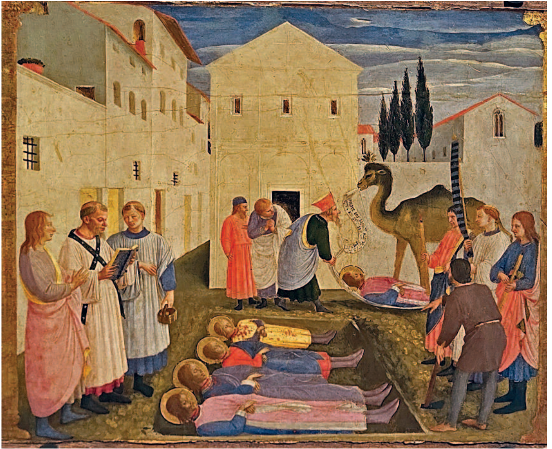
Beato Angelico, Sepoltura dei Santi Cosma e Damiano e dei suoi fratelli, dalla predella della Pala di San Marco, Firenze, Museo di San Marco (1438-1442 ca).

la Deposizione di Santa Trinita , commissionata per la loro cappella nella chiesa valdombrosana dagli Strozzi, in quel momento la famiglia più ricca e potente di Firenze, ma in contrapposizione con i Medici in ascesa nel governo della città. Cacciati gli Strozzi da Firenze, i Medici prendono l'assoluto sopravvento e con loro arriva anche per l'Angelico il momento di massimo successo a Firenze, sotto la protezione di Cosimo il Vecchio de' Medici e dell'Arcivescovo domenicano Fra' Antonio Pierozzi (futuro santo). Tra il 1438 ed il 1443 si svolge l'impresa artistica di San Marco, interamente finanziata dai Medici, che ne fanno uno dei centri della loro massima influenza in città, anche culturale ed artistica. Il convento venne completamente ricostruito dall'architetto (e scultore) di casa Medici Michelozzo di Bartolomeo. A Fra' Ange-