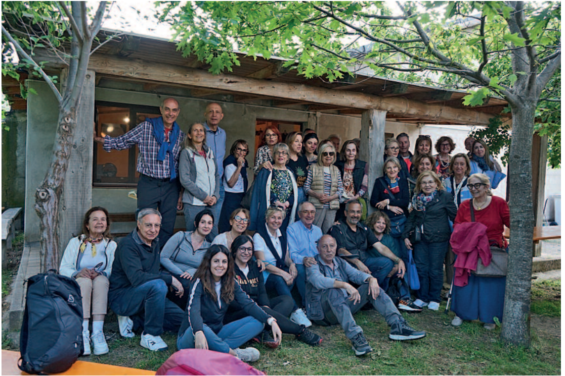
Viaggio del Presidente: Incanto d'Ogliastra – 23-24 maggio 2026.

evento di “Difesa personale e legittima difesa – “Consapevolezza, prevenzione e tutela di sé”, in sinergia con il Karate Club Kanazawa di Quartu Sant’Elena.