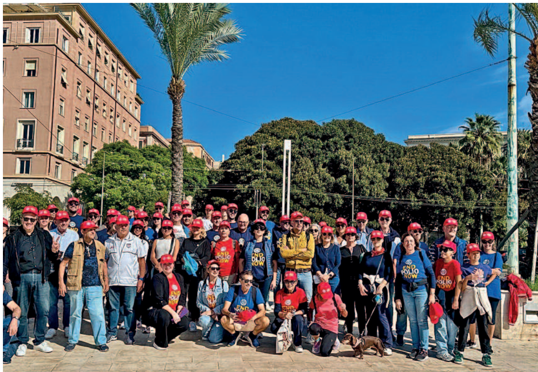
Passeggiata End Polio Now.

rito un confronto autorevole sui temi della sicurezza e della tutela del territorio.