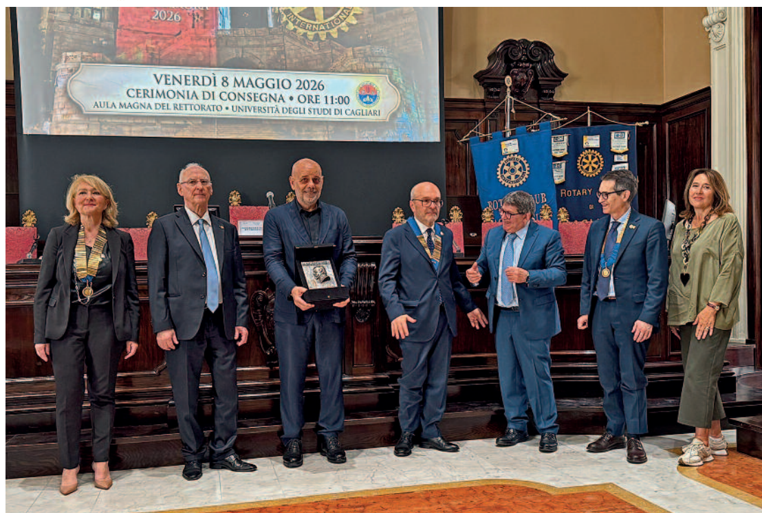
Premio La Marmora.

talizie a favore dei bambini e dei ragazzi dei reparti pediatrici cittadini, con l'obiettivo di offrire momenti di serenità e solidarietà. Di particolare rilievo anche l'impegno sociale a favore dell' Oasi di San Vincenzo , sostenuto attraverso iniziative benefiche e raccolte fondi destinate all'acquisto di libri e beni di prima necessità per i ragazzi ospitati nella struttura. Tra queste iniziative i Tornei di Padel hanno riscosso grande successo di partecipazione. Nello stesso ambito si inserisce il programma RYLA che, grazie al lavoro svolto nell'anno precedente, è stato integrato con la costituzione del nuovo Interact presso il Convitto Nazionale, valorizzando il mentoring professionale. Nel corso dell'anno, durante l'evento "Dalla scuola alla professione – Mentoring e Leadership Etica per il Futuro", sono inoltre state assegnate due borse di studio, offerte da Allianz, a studentesse meritevoli a partecipare al programma rotariano Youth Exchange del prossimo anno.