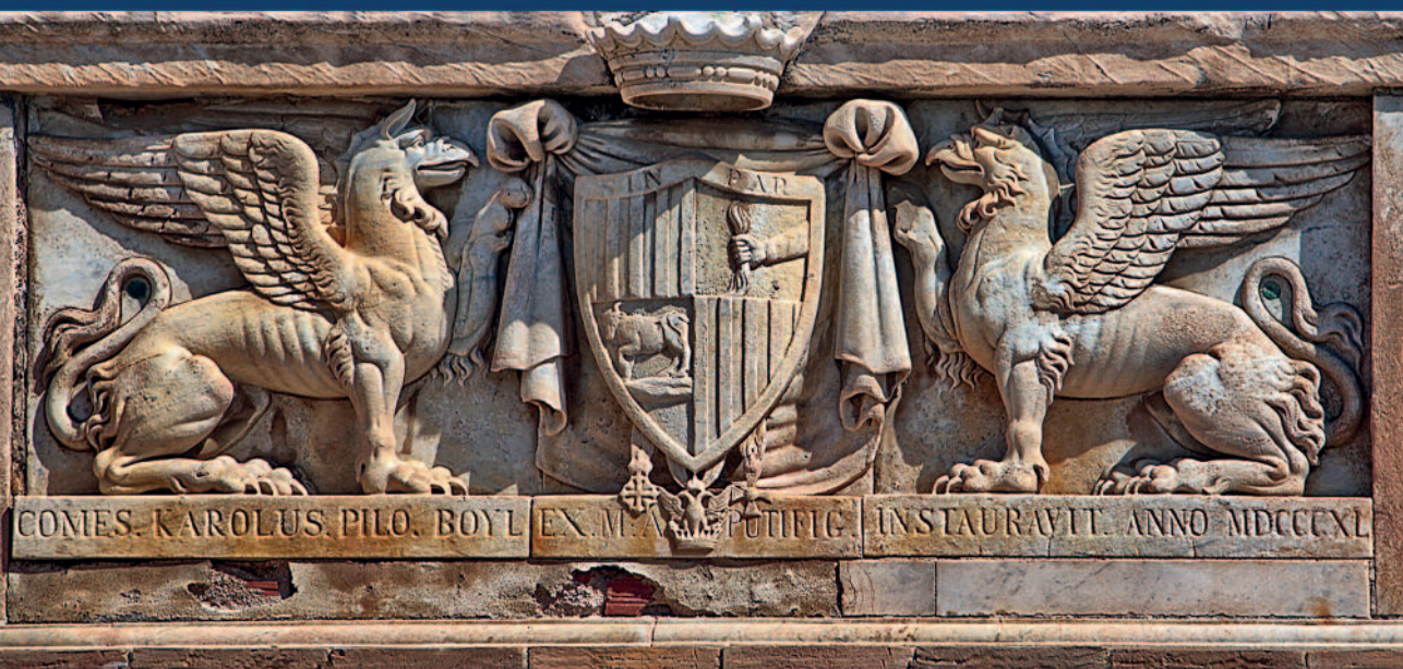
Stemma di Palazzo Boyd.