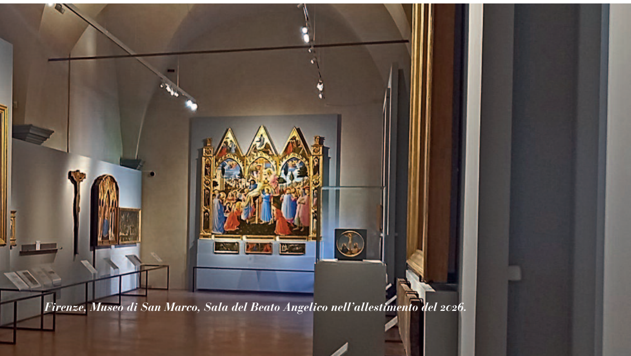
Firenze, Museo di San Marco, Sala del Beato Angelico nell'allestimento del 2026.

Una mostra quindi necessaria ed attesa, che offriva inoltre la possibilità di visitare, come parte del percorso, uno dei monumenti più affascinanti e rappresentativi della Firenze rinascimentale, il Convento domenicano di San Marco, museo nazionale dal 1869 e luogo che da sempre si identifica con il Beato Angelico. Qui Fra' Giovanni ha lasciato infatti il suo ciclo di affreschi più ampio e celebre, ancora sostanzialmente integro, distribuito tra gli spazi comuni della vita del convento (chiostri, sale comuni, refettorio) e le quarantaquattro celle riservate singolarmente al priore, ai chierici anziani, ai conversi e ai novizi. San Marco è un luogo dell'anima, frequentato da un pubblico attento ed esigente, in cerca di una esperienza autentica e non turistica, anzi intima e profonda, che lo distingue da tutti gli altri luoghi di Firenze, per quanto splendidi. La mostra ha intercettato questo interesse del pubblico e ha offerto anche a molti altri visitatori che non conoscevano San Marco una esperienza molto diversa da quella delle classiche mostre d'arte blockbuster , da visitare obbliga-