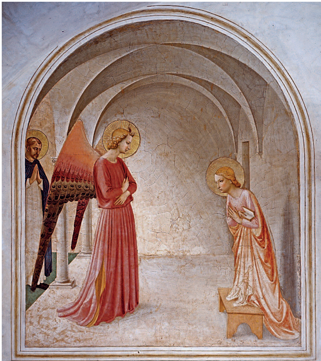
Beato Angelico, Annunciazione, affresco, cella 3 del Dormitorio dei Frati, Firenze, Museo di San Marco (1439-1441 circa).

toriamente per poter dire di esserci stati e per pubblicare foto sui social . Certo, ci sono state anche quelle, ed hanno fatto da enorme cassa di risonanza verso un pubblico molto ampio e giovane, ma l'esperienza reale e diretta, davanti alle opere e ai luoghi vissuti dal Beato Angelico, ha avuto una forza molto maggiore, e ha lasciato un segno indelebile in tutti coloro che l'hanno vissuta.