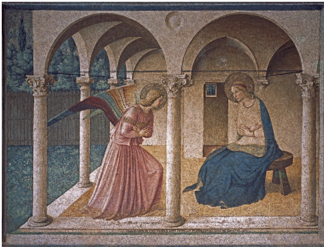
Beato Angelico, Annunciazione, affresco, Firenze, Museo di San Marco,, primo corridoio del dormitorio dei Frati (1443 circa).