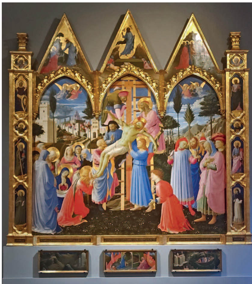
Beato Angelico, Pala di Santa Trinità (Deposizione dalla Croce) – Firenze, Museo di San Marco (1430-1432 ca.)

Con 250.000 visitatori registrati nella sede di Palazzo Strozzi e 100.000 nella sede del Museo di San Marco, Beato Angelico ha bat-