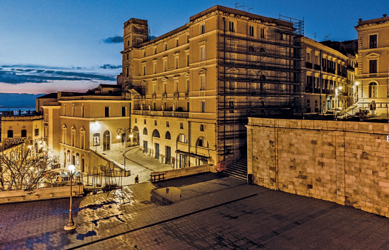
Palazzo Boyd – foto di Stefano Mattana.